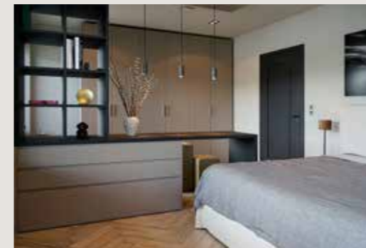
Offene Raumsituation mit Bett und Ankleidebereich