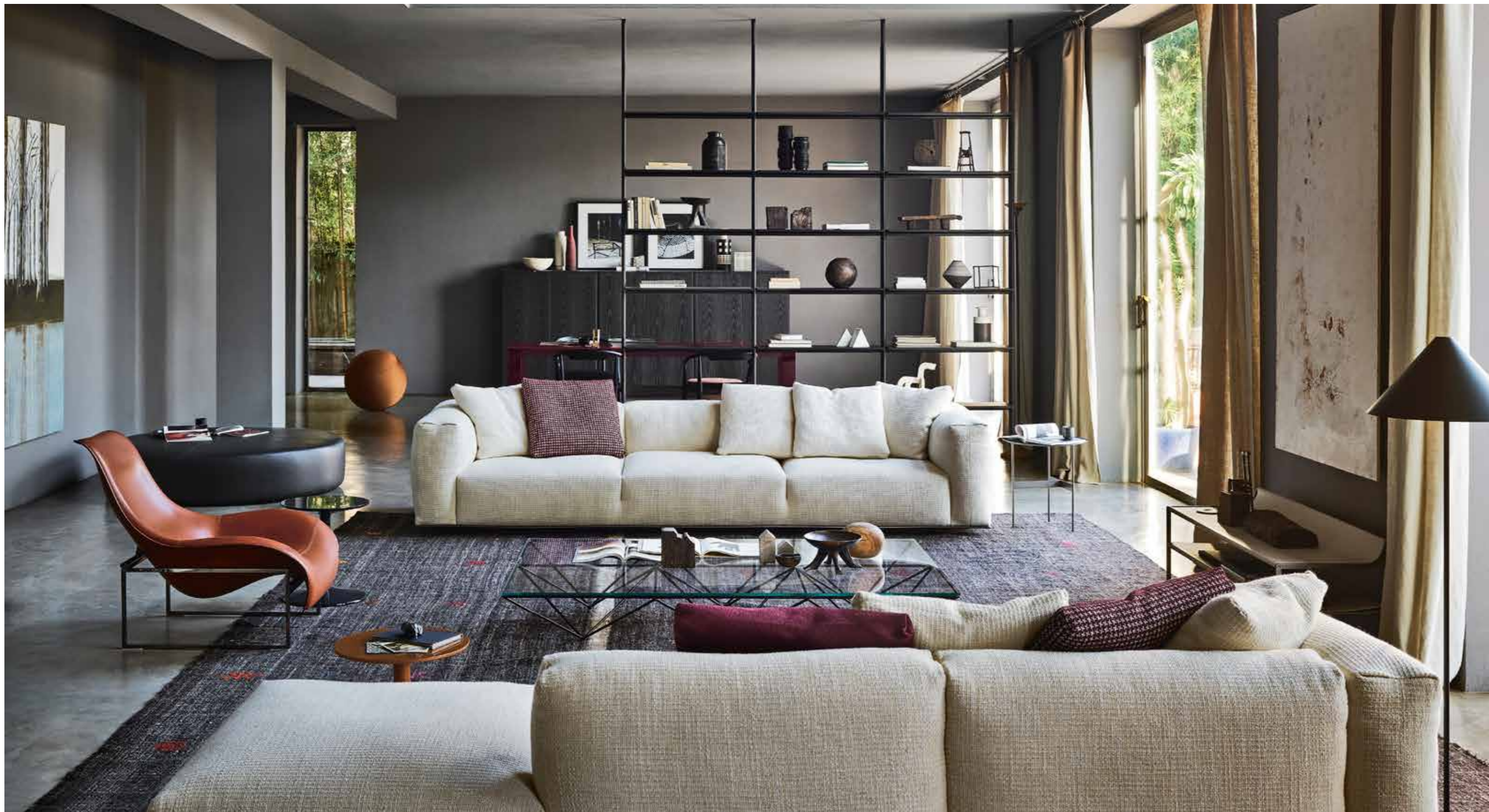
Dambovue – ein Meisterwerk des zeitgenössischen Designs.