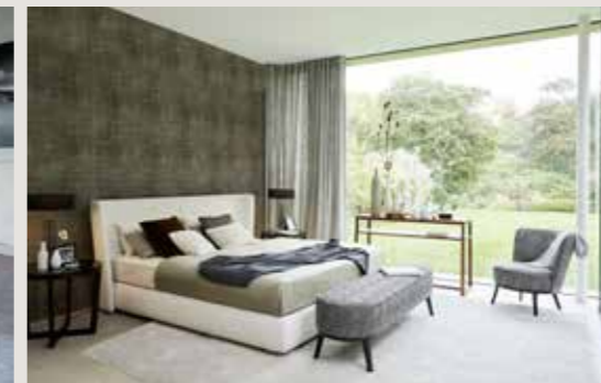
Vielseitige Möglichkeiten mit solitären Einzelmöbeln