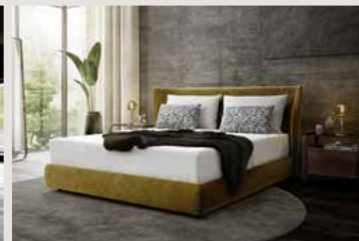
Die Farben und Formen bilden die Verbindung nach außen.