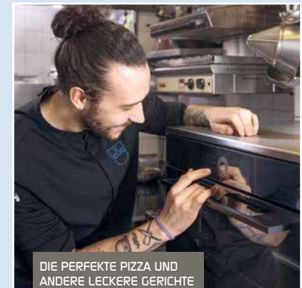
DIE PERFEKTE PIZZA UND ANDERE LECKERE GERICHTE AUS DEM HEISSEN OFEN