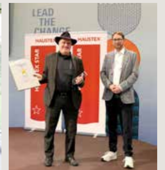
Preisverleihung Januar 2026