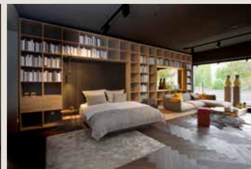
Ein Loft für Vielleser mit Wohn- und Schlafbereich.